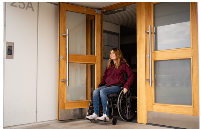
Känn er trygga med våra produkter. Det här är kvalitetsprodukter som bara går och går med minimalt underhållsbehov.